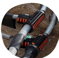
RÉSEAUX DE CHALEUR alimentés par des énergies renouvelables