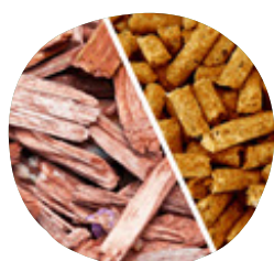
BIOMASSE (bois plaquettes ou granulés)